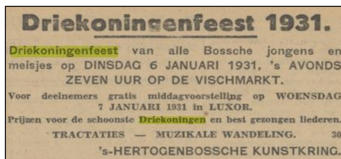
PNHC 5 januari 1931