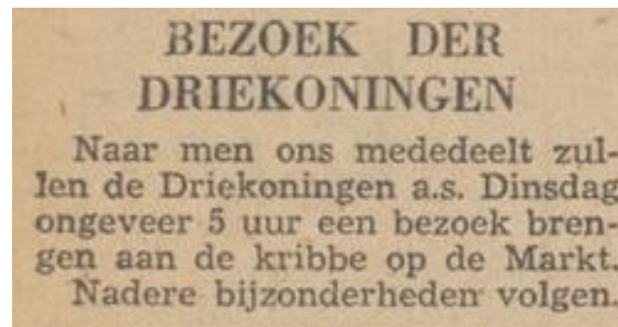
PNBC Het Huisgezin 3 januari 1948

Verzamelen bij Royal in de Visstraat. Met muziek van het Koninklijk 's- Hertogenbosch Muziekkorps naar het stadhuis. Burgemeester sluit aan. Geschenken bij de kribbe in de stal op de Markt. Daarna naar Bisschoppelijk Paleis en Gouvernement. Ontbinden op Markt. Collecte voor de Stille Armen.