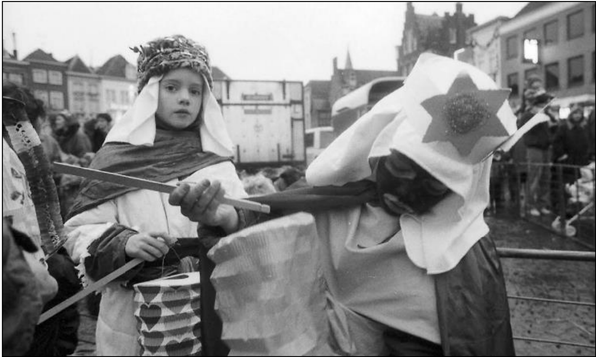
Driekoningen 1992.