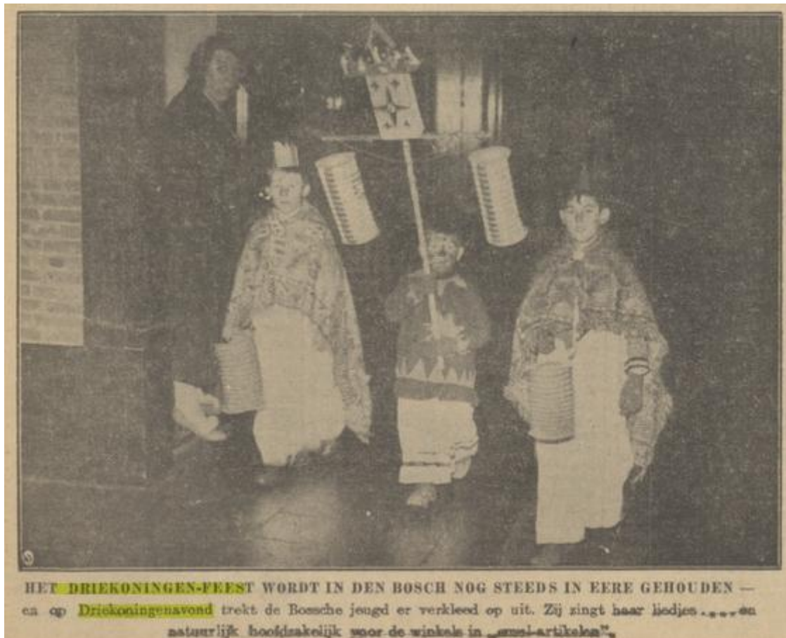
PNHC 8 januari 1938