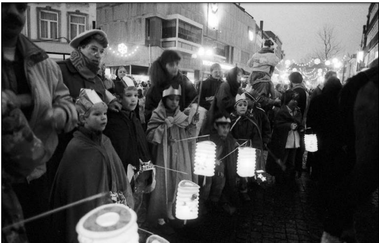
1989. Driekoningenintocht.

Zondag 8 januari. 16.30u Verzamelen bij Burgemeester Loeffplein. Gratis lampions. Met muziek van het Koninklijk 's-Hertogenbosch Muziekkorps. Herders en schapen. CV De Jokers als herders. Burgemeester sluit aan, naar de Sint Jan. Geschenken bij de kribbe in de stal in de Sint Jan . Ontvangst plebaan v.d.Camp en Bisschop Terschure. Bij uitgang kerk: traktatie en prijsuitreiking. Ontbinden op de Parade. Nu voldoende geld, bijdragen van Horeca. 800 kinderen.