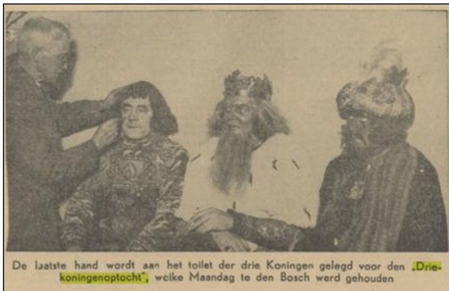
De laatste hand wordt aan het toilet der drie Koningen gelegd voor den Drie-konigenoptocht , welke Maandag te den Bosch werd gehouden