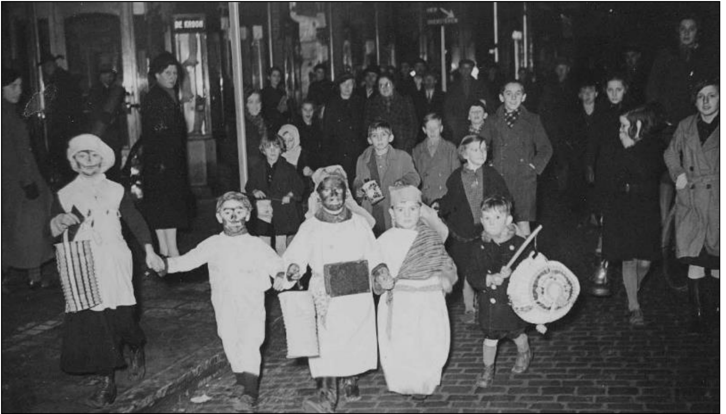
1939. Driekoningzingen.