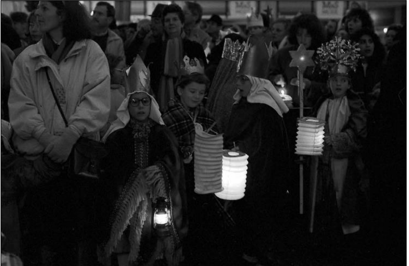
1990. Driekoningenintocht.

Zondag 7 januari. 16.30u Verzamelen bij Burgemeester Loeffplein. Gratis lampions. Met muziek van het Koninklijk 's-Hertogenbosch Muziekkorps. Herders en schapen. CV De Jokers als herders. Burgemeester sluit aan, naar de Sint Jan. Geschenken bij de kribbe in de stal in de Sint Jan . Ontvangst plebaan v.d.Camp en Bisschop Terschure. Bij uitgang kerk: traktatie en prijsuitreiking. Ontbinden op de Parade. Meer kinderen dan ooit. Goed weer.