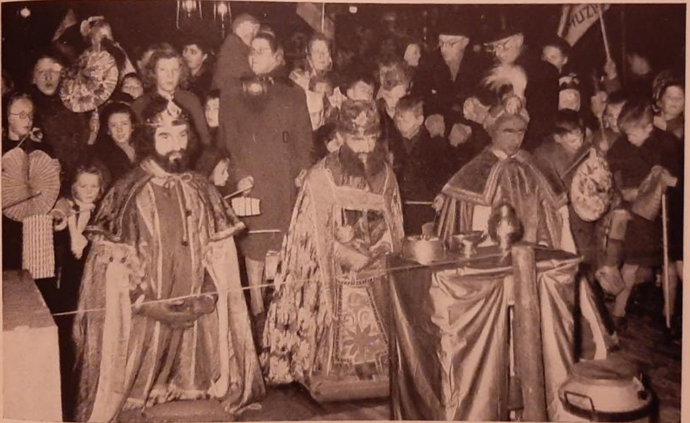
Op Driekoningenavond 1949 knielden Melchior, Balthazar en Caspar neer voor het kribbeke op de Grote Markt te 's-Hertogenbosch.