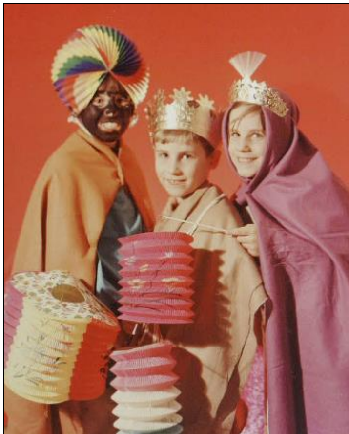
1966. Driekoningenzingen.