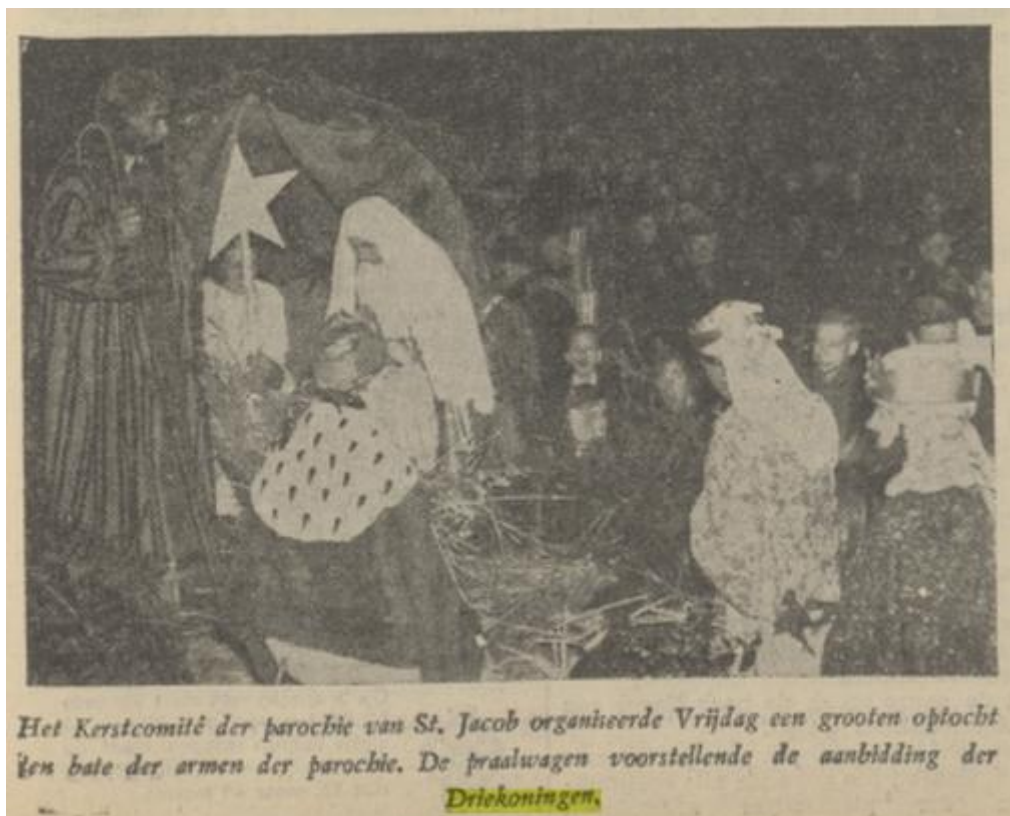
PNHC 7 januari 1939

Alleen optocht ten bate van de armen in parochie Sint Jacob.