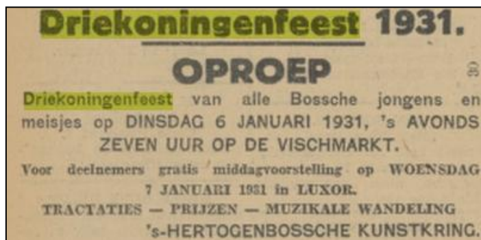
PNHC 31 december 1930

Wedstrijd van 'honderden' Driekoningen op de Vismarkt met jurering door leden van 's-Hertogenbossche Kunstkring. Daarna muzikale tocht door de stad met 's-Hertogenbosch Muziekkorps. Daarna kindervoorstelling in theater Luxor. Hulp voor passende verlichting op de Vismarkt van de gemeente en van de Padvinders ("We kunnen ons in de toekomst geen Driekoningenfeest meer indenken zonder de hulpvaardigheid").