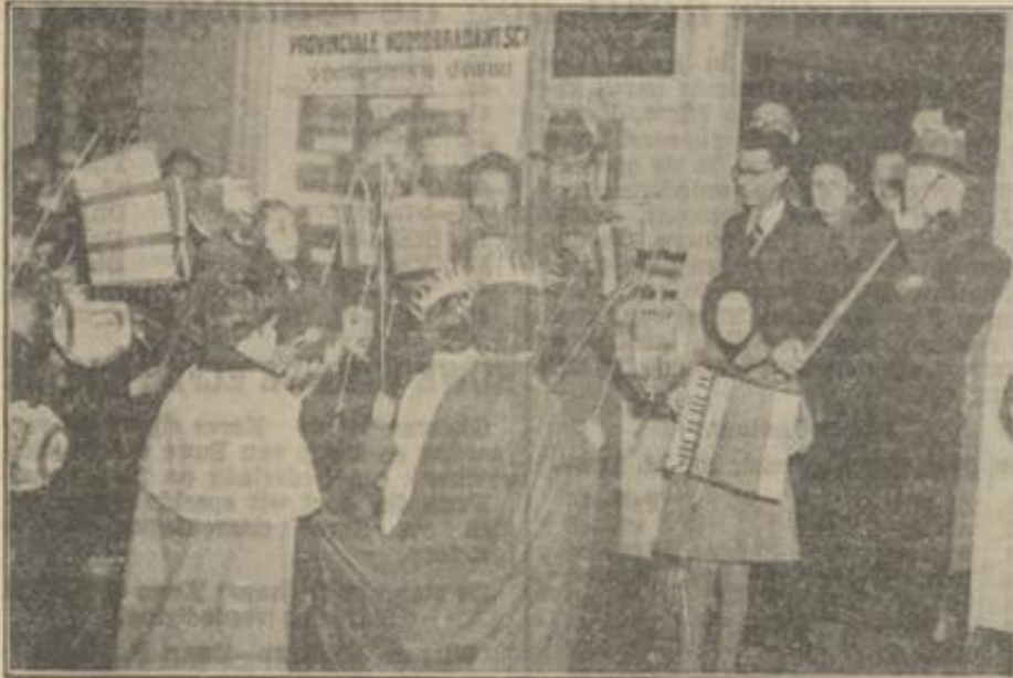
Het groepje van Driekoningen voor ons kantoor.

De kleinen gingen vol vertrouwen met hun lichtjes en verlangens rond, op zoek naar den Heer.