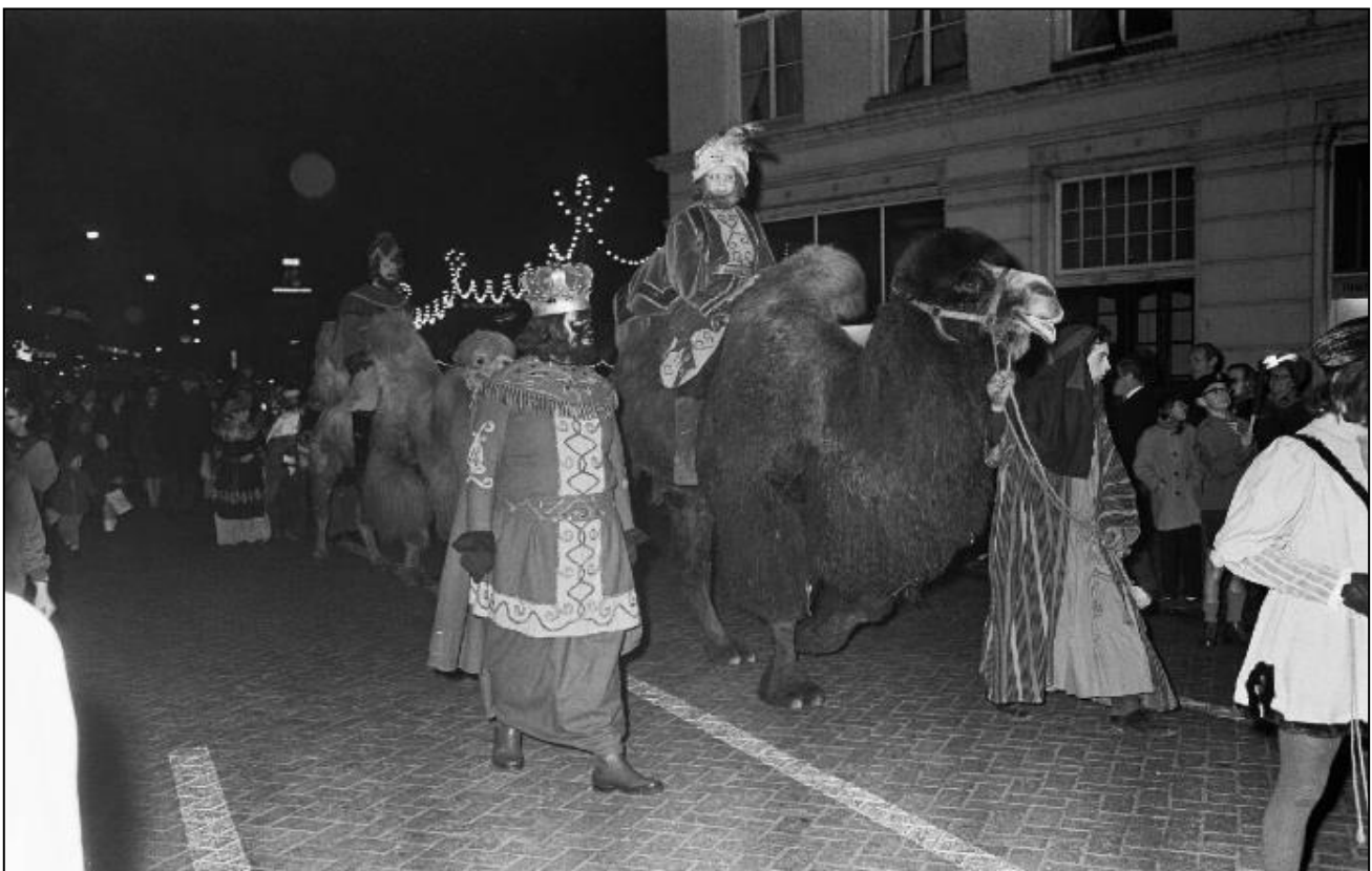
1969. Driekoningenintocht.

Zaterdag 4 januari. 16.30u Verzamelen bij Burgemeester Loeffplein. Met muziek van het Koninklijk 's- Hertogenbosch Muziekkorps in drie groepen gesplitst. Met Schola Cantorum. Stoet met herders te paard, grote ster, herders met geschenken, twee kamelen, kudde schapen, fakkeldragers. Burgemeester sluit aan, naar de Sint Jan. Geschenken bij de kribbe in de stal in de Sint Jan. Ontvangst door de plebaan. Nieuwe bloei van de optocht: 1000 kinderen. Traktatie bij verlaten kerk door de Driekoningen zelf. Prijsuitreiking voor 100 deelnemers. Ontbinden op de Parade. Collecte voor de Stille Armen.