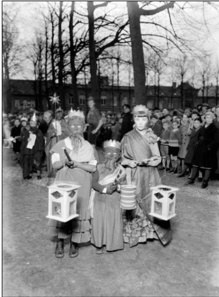
6 januari 1936. Driekoningen op de Parade