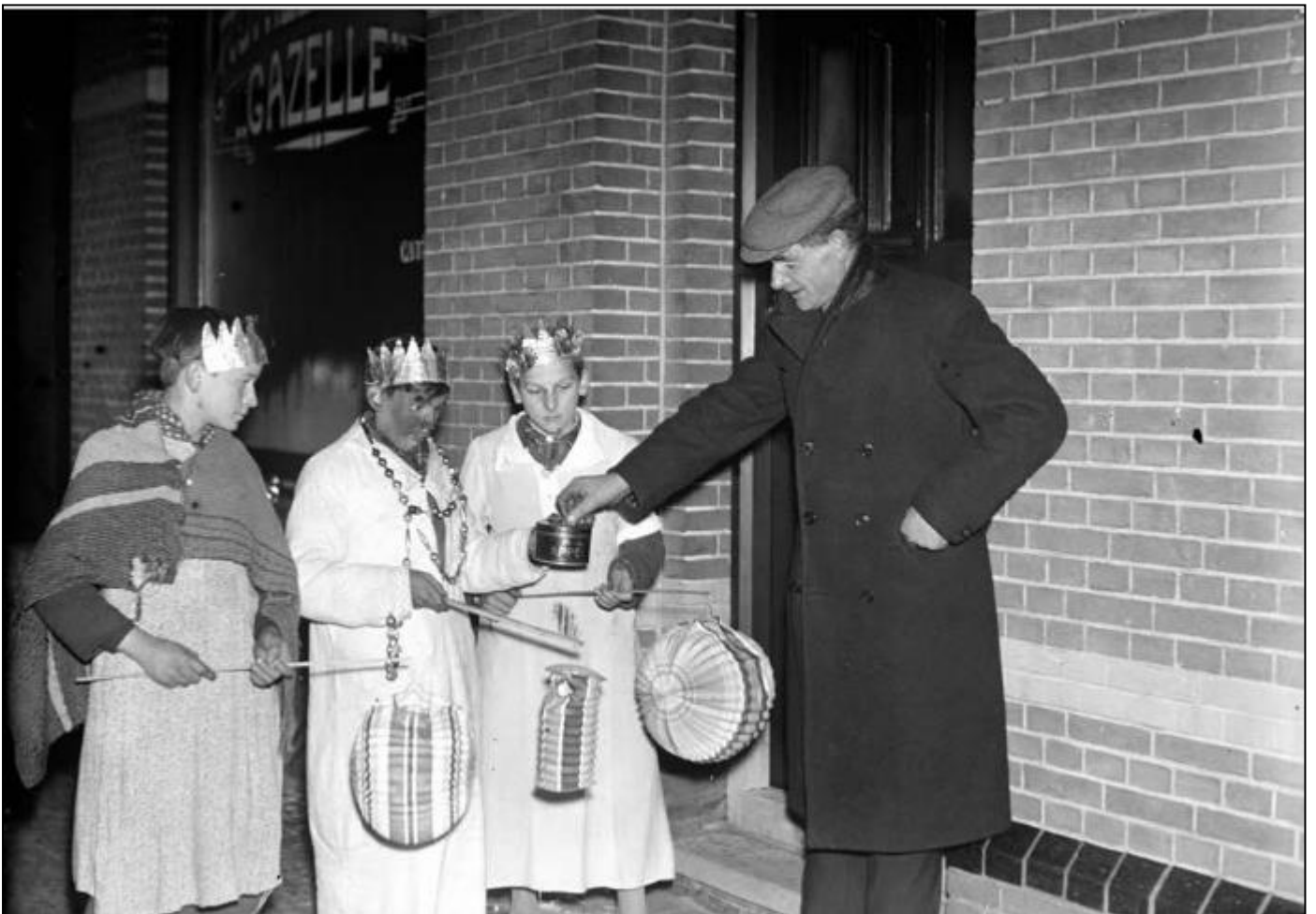
6 januari 1940.