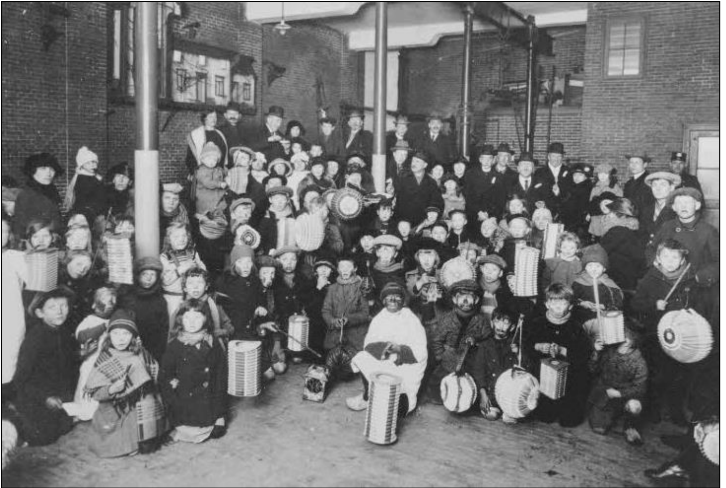
6 januari 1924. Driekoningenzingen, prijszingen in de Boterhal. Gehaal achterste rij de juryleden van de 's-Hertogenbossche Kunstkring. Op de voorgrond de 'koninkjes'.

Zo'n 1500 kinderen doen mee aan de wedstrijd die in de Boterhal plaatsvindt. Een jury, bestaande uit leden van de 's-Hertogenbossche Kunstkring , onder leiding van Herman Moerkerk, beoordeelt de 'koninkjes' op hun uitdossing en lied. De kinderen worden getrakteerd op chocolade en de winnaars ontvangen mooie prijzen. Daarna trok men in een stoet door enkele straten.