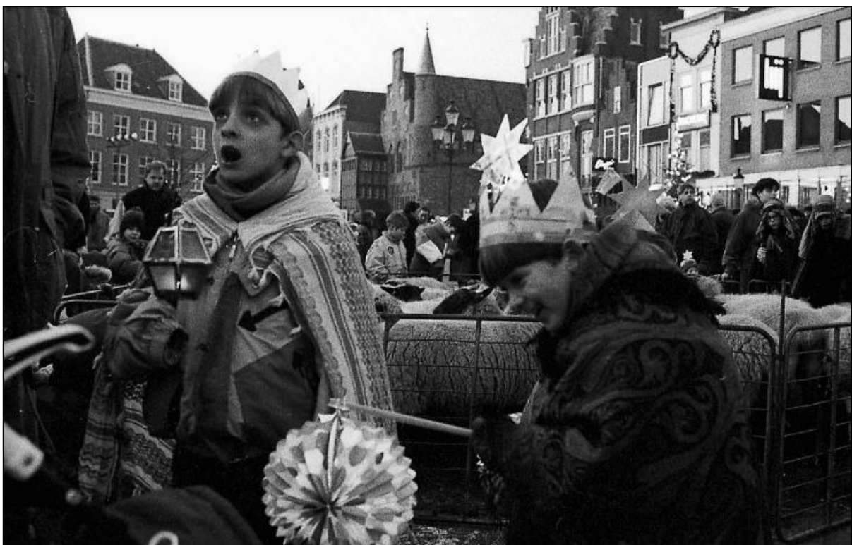
1993. Driekoningenintocht.