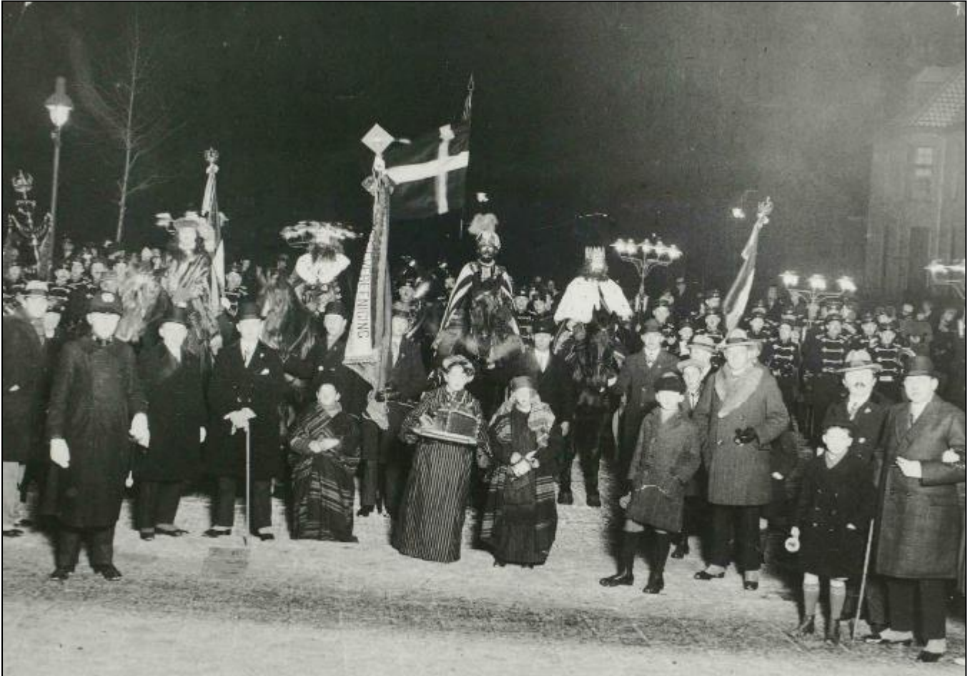
6 januari 1929. Driekoningenoptocht

Stoet wordt voorafgegaan door een drietal edelknapen met goud, wierook en mirre. Een heraut met het vaandel van de missievereeniging met Koninklijk Muziekkorps Goulmy en Baer. Met een 20-tal knapen met lampions en collectebussen.