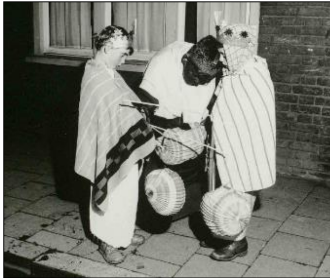
1958. Driekoningenzingen.

Zondag 5 januari. Voor het eerst niet op 6 januari. 17.45u Verzamelen bij Putters. Geschenken bij de kribbe in de stal op de Markt. Slecht weer, geen muziek en weinig koninkjes. Bisschoppelijk Paleis en daarna Gouvernement. Ontbinden op Markt. Collecte voor de Stille Armen.