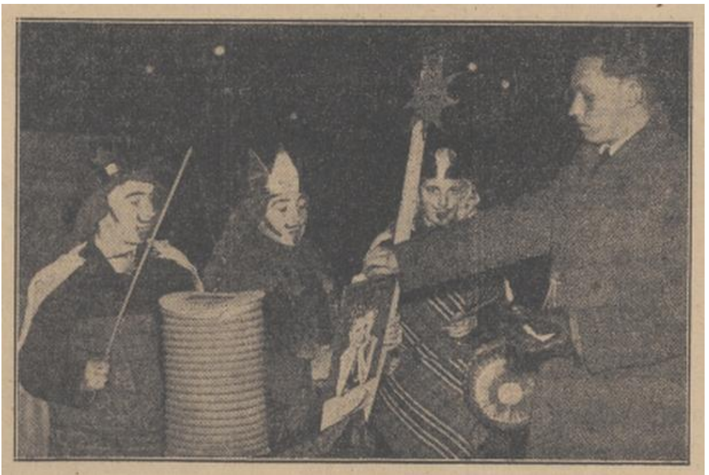
PNBC Het Huisgezin, 7 januari 1948

1949. Driekoningentocht georganiseerd door het Centrum-Comité. Met volwassen Driekoningen te paard.