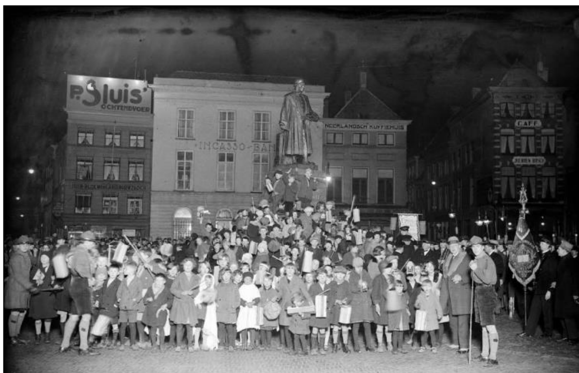
6 januari 1931. Driekoningen rondom het beeld van Jeroen Bosch op de Markt.