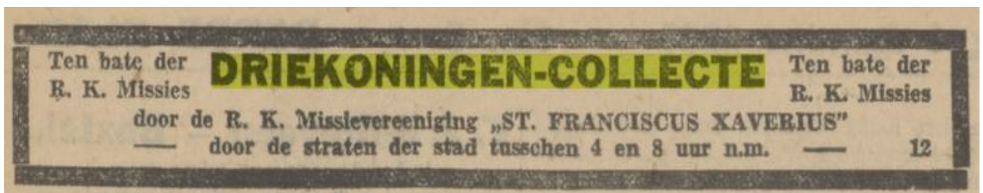
PNHC 4 januari 1930

Deze keer slechts een wagen met een ster en een wagen met grammofoonmuziek.